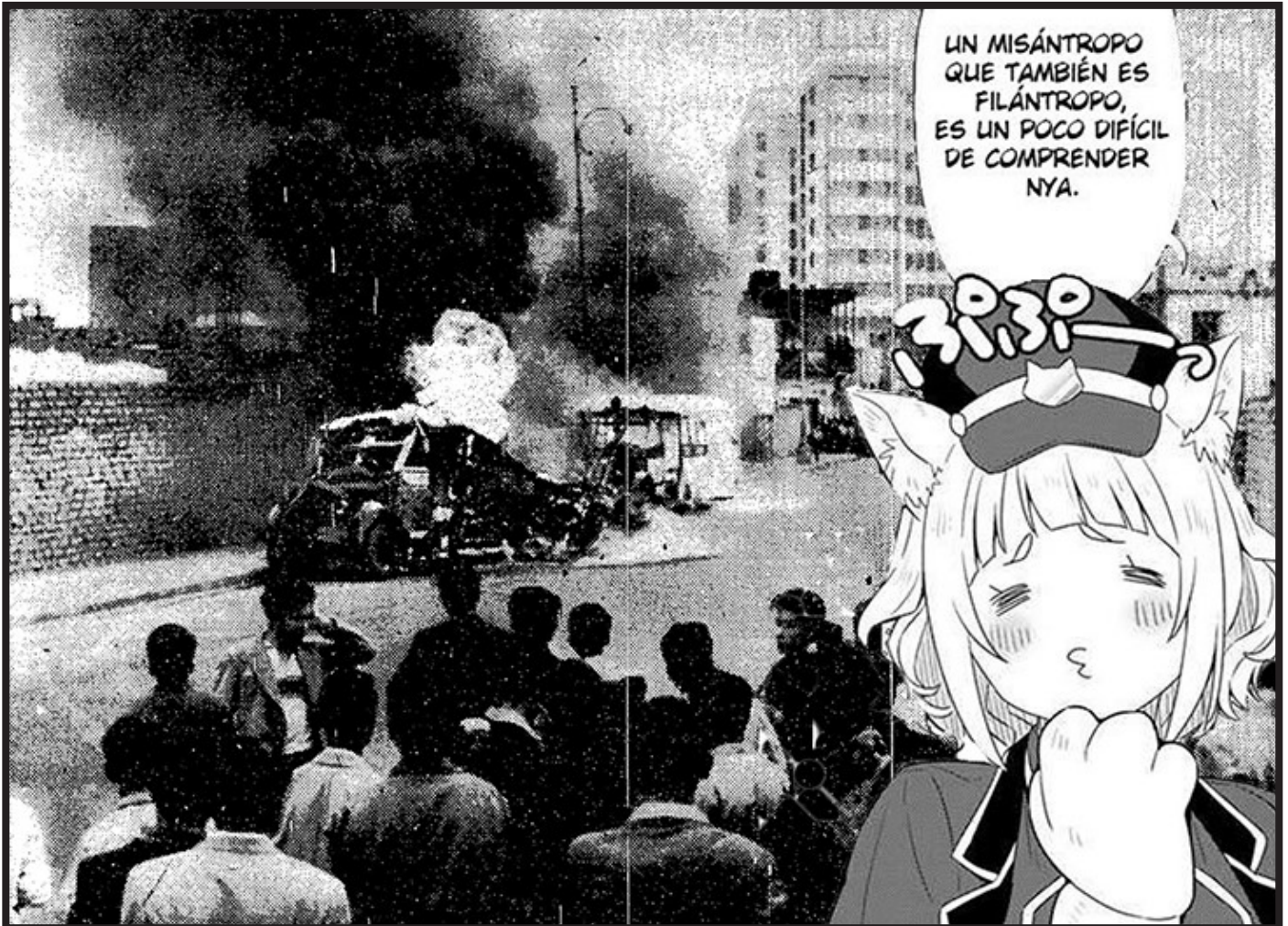
oxímoron: protesta de trabajadores de la ipc en lima (29-vi-1956)