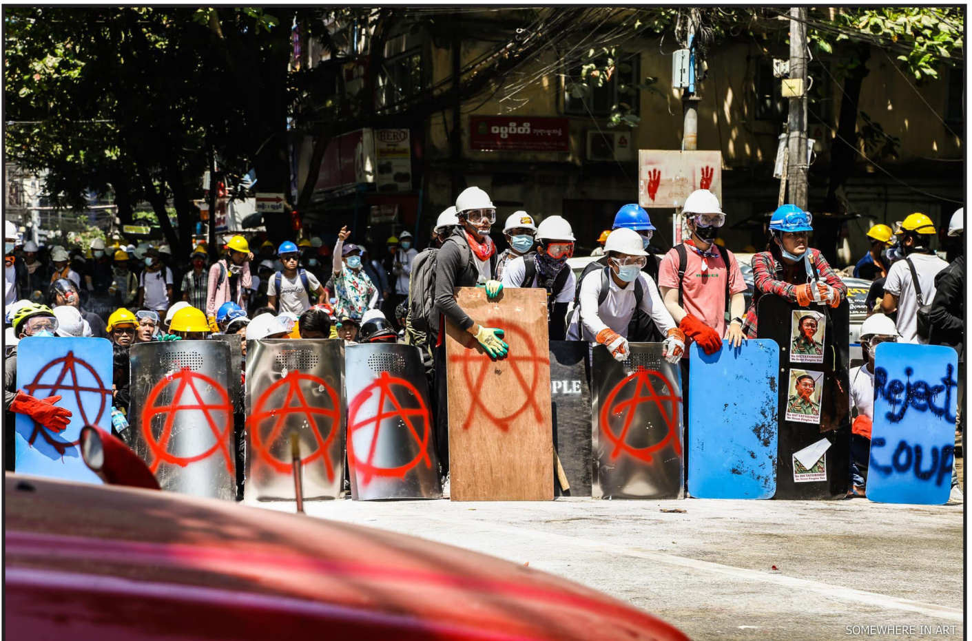
SOLIDARIDAD CON LXS ANARQUISTAS QUE RESISTEN EN MYANMAR, KYUN TAW ROAD