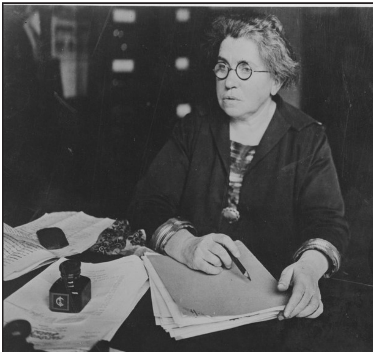
EMMA GOLDMAN, UNA VEZ MAS DEPORTADA... (1919): RUMBO A JODER A LOS REACCIONARIOS DE LOS BOLCHEVIQUES!